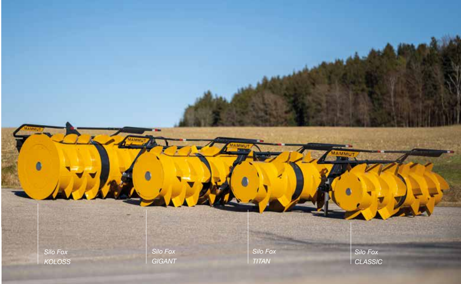
Silo Fox KOLOSS